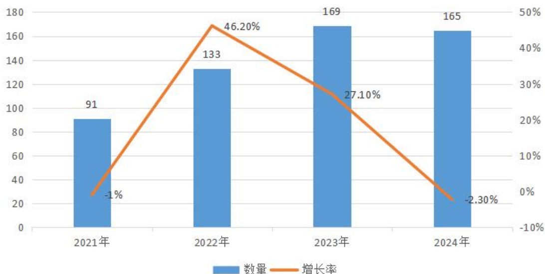
近四年兖州区依申请公开数量

从答复情况来看，予以公开 52 件，部分公开 23 件，不予公开 16 件，因本机关不掌握相关政府信息而无法提供 48 件，因没有现成信息需要另行制作而无法提供 2 件，不予处理 7 件，其他处理 3 件。